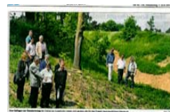
Doline Eutenhofen fertig saniert

Im Rahmen der Kreisausschuss-Sitzung vom 30.06.2014 wurden per einstimmigen Beschluss die Teilnahme am LEADER-Auswahlverfahren und die Bereitstellung der notwendigen Finanzmittel für die nächste LEADER-Förderperiode beschlossen. Ein sehr positives Zeichen für die bisherige und zukünftige LEADER-Arbeit im Landkreis Kelheim.